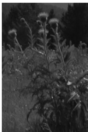
Rhaponticum carthamoides (Willd.) - Маралий корень