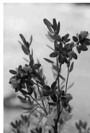
Rhododendron dahuricum - Рододендрон даурский