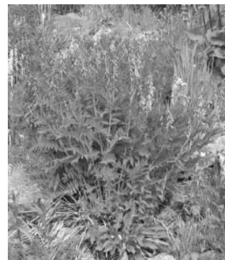
Hedysarum theinum Krasnob - Красный корень