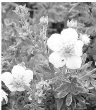
Pentaphylloides fruticosa - Курильский чай кустар- никовый